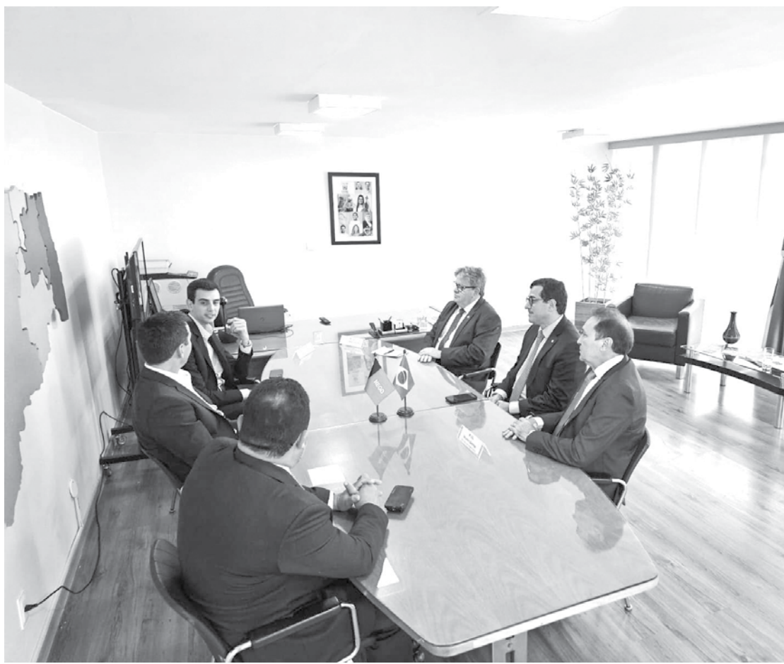
Governador João Azevêdo durante a reunião com os diretores da companhia Azul Linhas Aéreas

O chefe do Executivo estadual explicou que a pretensão é expandir a malha aérea na Paraíba. “Nós sabemos da grande demanda do Alto Sertão e da grande capacidade de produção da região e que precisa ser exportada de forma rápida, por