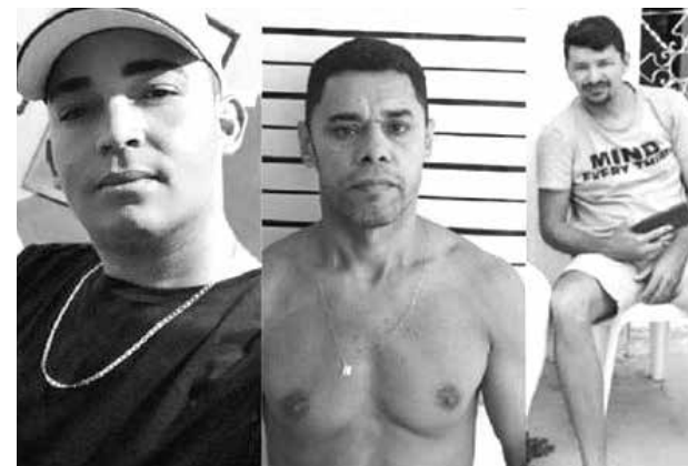
O grupo estava fortemente armado em Cubati

■ Identidades dos sete assaltantes foram reveladas pela polícia, após necropsia no Numol de Campina