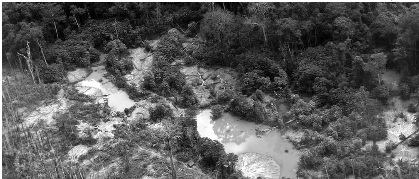
O contrabando de ouro é oriundo de garimpos ilegais na Amazônia, e a Justiça bloqueou mais de R$ 2 bi dos investigados

O ministro do Desenvolvimento e Assistência Social, Família e Combate à Fome, Wellington Dias, já havia antecipado que o governo trabalha na edição de uma medida provisória (MP) que vai estabelecer as diretrizes do novo Bolsa Família. Uma MP tem força de lei, ou seja, efeito imediato, mas precisa ser aprovada pelo Congresso em até 120 dias para manter a validade. Os parlamentares também podem apresentar propostas de mudança no texto.