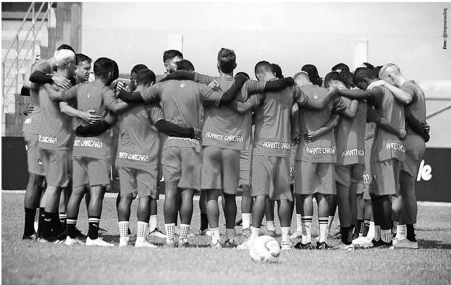
Nas três últimas rodadas que faltam, a Queimadense vai lutar para evitar o rebaixamento e precisa vencer o CSP para ter mais tranquilidade no certame

Após o confronto de hoje, as duas equipes terão mais duas partidas cada para definirem os rumos na competição. A Queimadense recebe o Nacional como mandante e encerra a competição como visitante contra o Treze, sendo as duas partidas realizadas em Campina Grande. Já o CSP enfrenta Nacional e Sousa, com duas partidas a serem realizadas em Patos e Sousa, respectivamente.