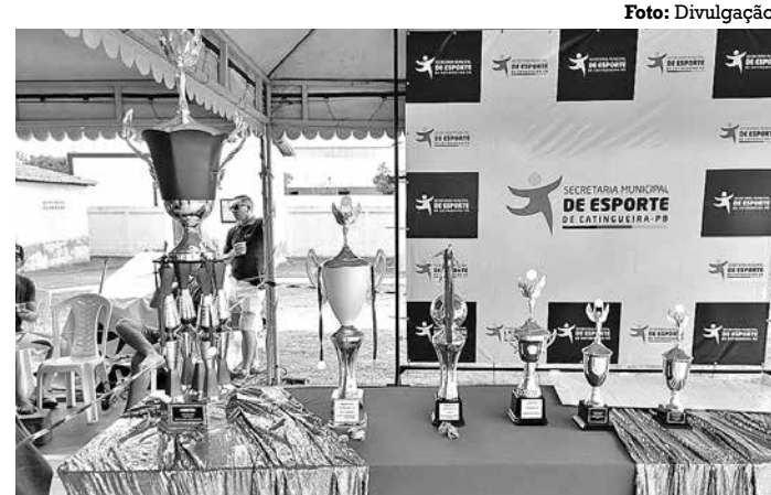
Além de troféus e medalhas, R$ 40 mil estarão na disputa