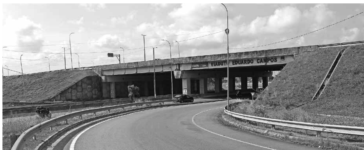
O viaduto do conjunto Ernesto Geisel homenageia o ex-governador de Pernambuco Eduardo Campos