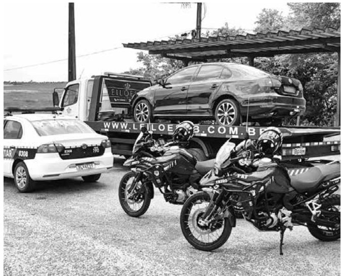
Após fuga, veículo foi alcançado próximo a Café do Vento

A Polícia Rodoviária Federal, em ação conjunta com a Polícia Militar da Paraíba prendeu, em Sobrado-PB, um foragido da Justiça pelo crime de roubo. O fato aconteceu quando equipe da PMPB realizava rondas no município de Santa Rita, quando visualizou um veículo Jetta preto. A fim de fazer uma fiscalização, foi dada ordem de parada ao automóvel que não foi obedecida. O veículo empreendeu fuga na BR-230 indo em direção a Campina Grande. Prontamente a equi-