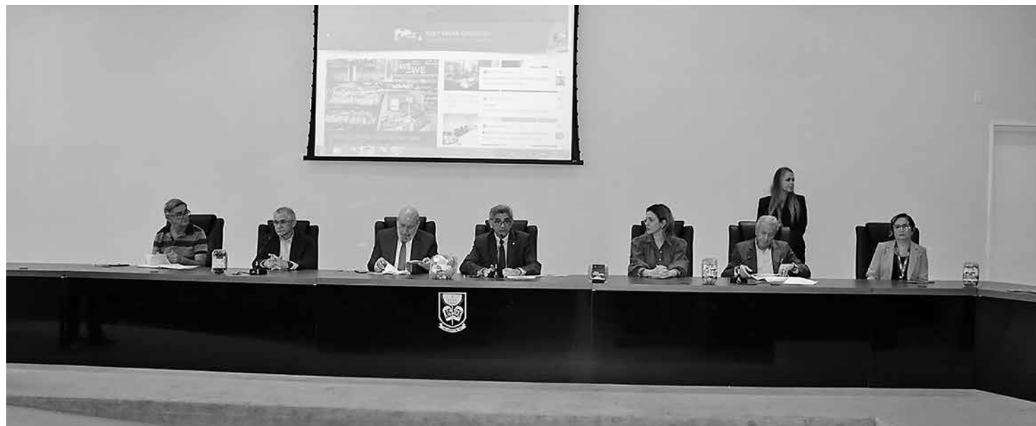
Representantes do Ministério Público, da Abras e da ASPB participaram do evento, que detalhou o programa de monitoramento de produtos

O subprocurador ressaltou a relevância da parceria institucional. “A proposta do Ministério Público é a parceria com o setor de supermercados, que é parte interessada em vender alimento de qualidade aos clientes e proporcionar a entrega de um produto saudável. Essa reunião trata de expandir e aprimorar