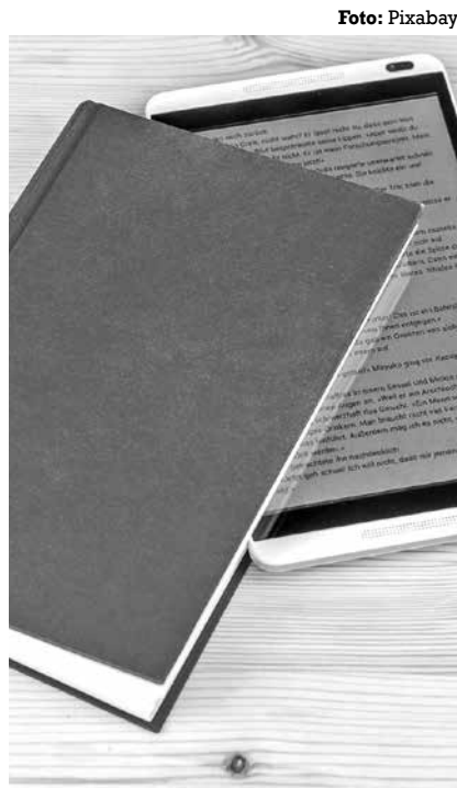
Livro impresso 'versus' formato digital

Se há pregoeiros desse fim do livro e do jornal porque é fatídico e inexorável esse fim de capítulo da história do impresso. Aceitar passivamente essa novela de mau gosto. Acreditar de boa-fé que o formato digital vai suprir a ronda histórica de ler e escrever.