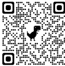
Através do QR Code acima, acesse o site da Rádio Tabajara

Antenado com as convergências de plataformas, o programa – que só toca música da Paraíba – pode ser ouvido pelo site oficial da Rádio Tabajara ( radiotabajara.pb.gov.br/radio-ao-vivo/ ) e, no dia seguinte à apresentação, fica disponível no canal oficial da Funesc no YouTube ( /TvFunesc ).