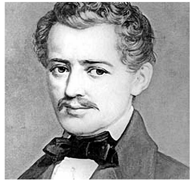
Compositor austríaco do período romântico Johann Strauss