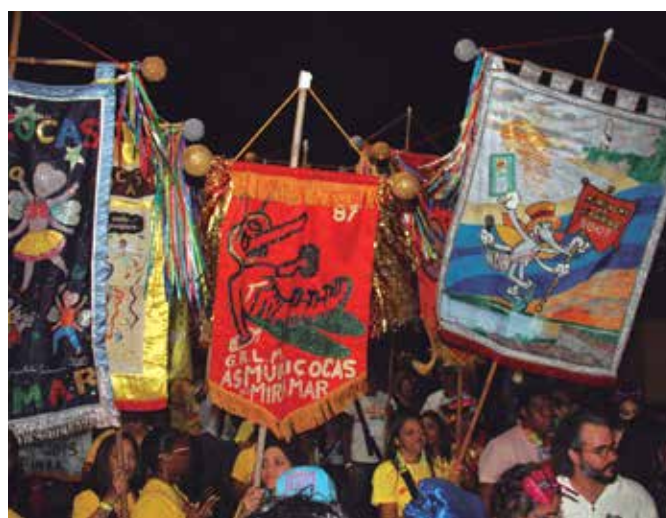
Mestre Fuba (acima) é fundador do bloco; desfile de estandartes abriu a festa; PMs utilizaram “bodycams” durante as ações