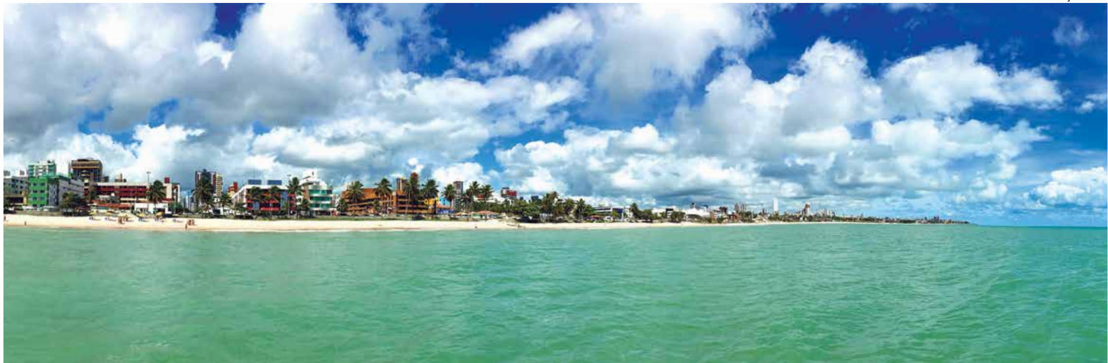
Projeto do prefeito de João Pessoa, Cícero Lucena, prevê a retirada de areia do fundo do mar para ampliar a faixa das praias numa ação com objetivo de conter a erosão que atinge a orla da capital