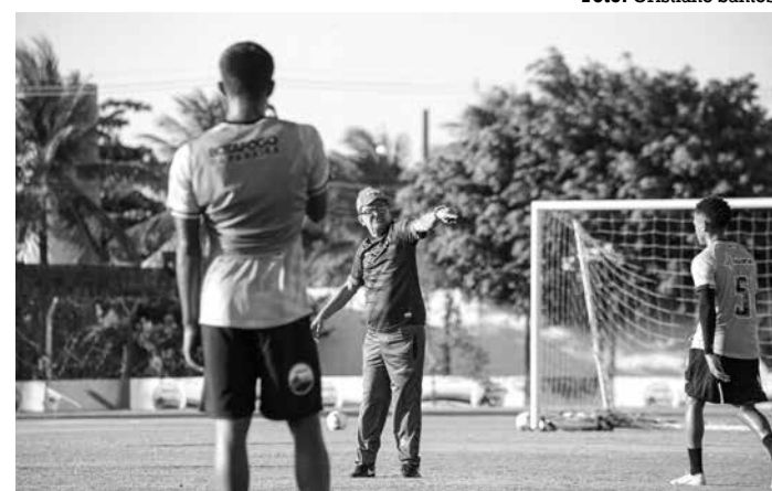
Botafogo tem que conquistar mais seis pontos para a classificação

valesco, no sábado (25), a partir das 16h, no Estádio Almeida, em João Pessoa, contra o São Paulo Crystal, partida que vai complementar a oitava rodada da competição estadual.