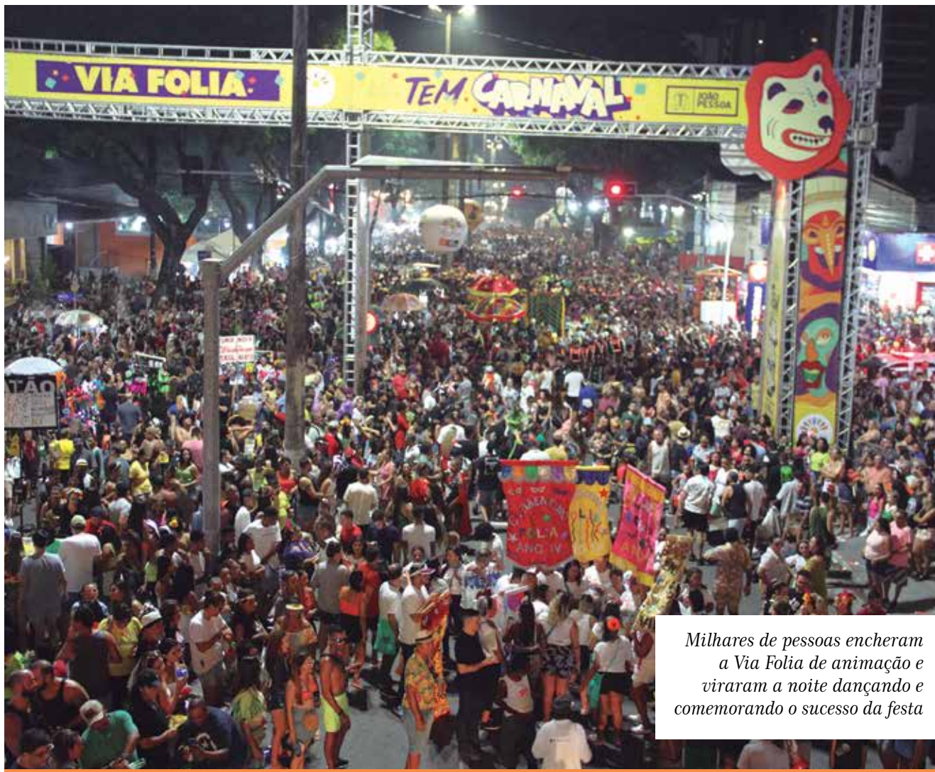
Milhares de pessoas encheram a Via Folia de animação e viraram a noite dançando e comemorando o sucesso da festa