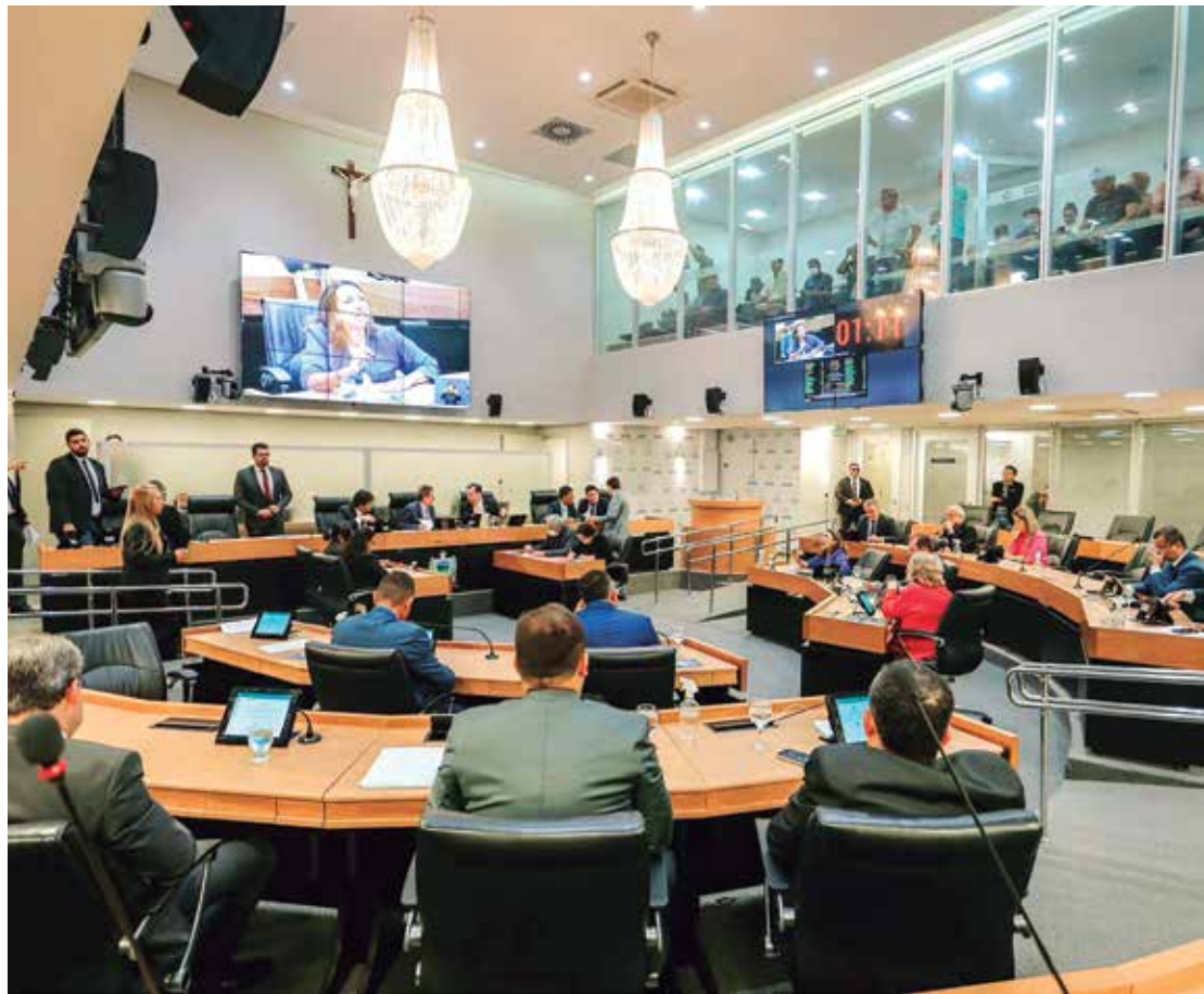
Os deputados começam a definir os blocos em que atuarão nas articulações na Assembleia