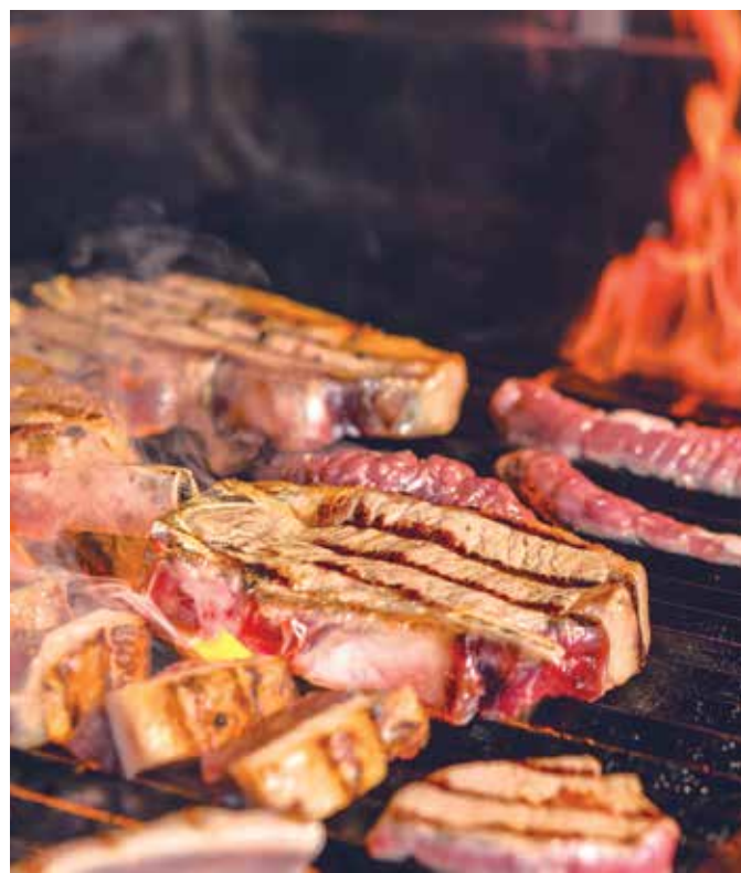
Valor da cerveja chega a variar mais de 62% nos estabelecimentos, enquanto nos itens de churrasco a variação ultrapassa os 100%