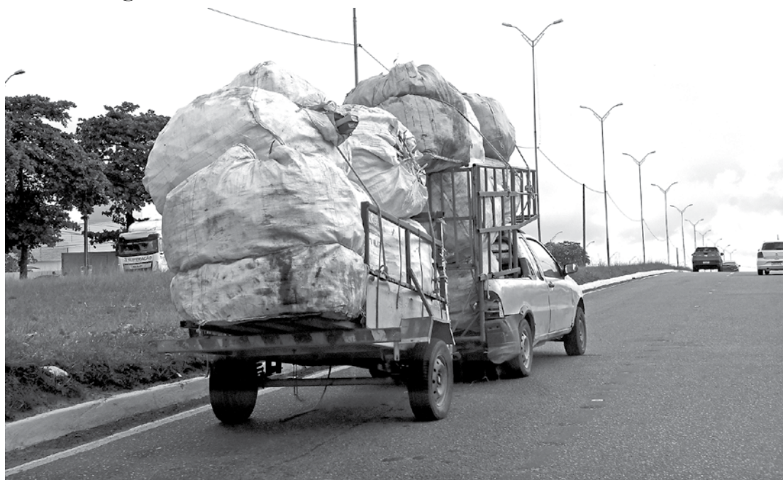
Carga é um perigo na BR